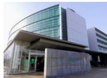
杏林大学医学部付属病院徒歩8分

入居のご相談は..... (株)ナーシングコンシェル ☎080-4123-1939 24時間週7日連絡可 ✉watanabe@nursing-concier.com