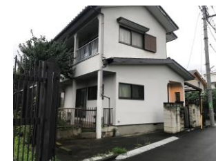
古民家リノベーション