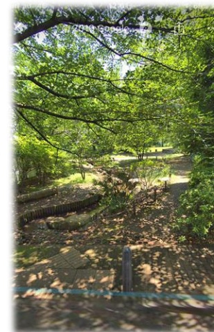
新川丸池公園徒歩3分