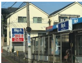
スーパーBig・A前の路地入り、2つ目右折、坂上がる