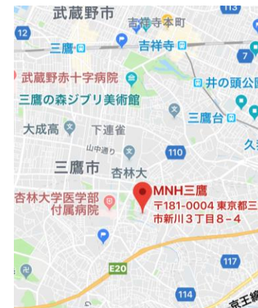
仙川駅北口よりバス7分