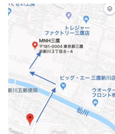
新川団地中央バス亭徒歩5分